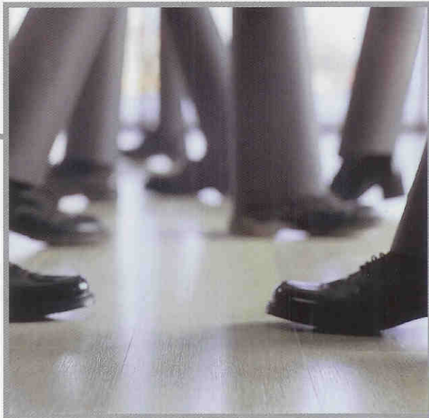
Clase de Abrasión

La superficie TitanX Surface™ confiere al suelo PERGO una increíble resistencia al desgaste que le permite alcanzar los requisitos del estándar para uso comercial intenso. Consta de dos capas superpuestas (tres en PERGO Uniq) colocadas de tal forma, que juntas hacen que los suelos PERGO sean los suelos laminados más duraderos del mercado. Esta es la razón por la que, al comprar un suelo PERGO, conseguirá la mejor garantía del mercado.