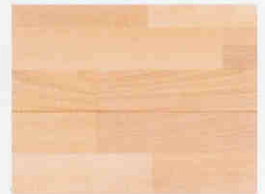
UNIÓN DÉBIL = aperturas que acumulan suciedad