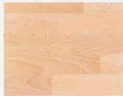
UNIÓN RESISTENTE = sin aperturas